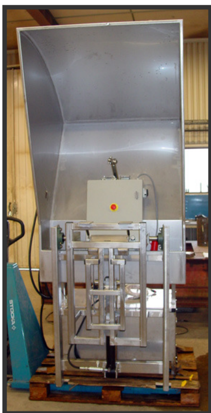
Maskiner och maskinkomponenter

För villa och trädgård, båt och butik – brevlådan är ett exempel på vad vår personal kan åstadkomma!